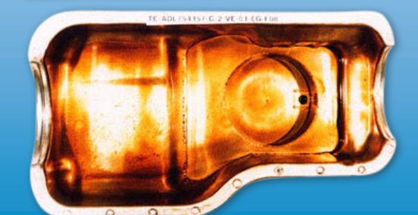
Motorenbauteil nach Standardtest mit Motorenöl mit XMF® Technologie